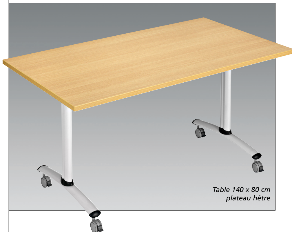
Table 140 x 80 cm plateau hêtre