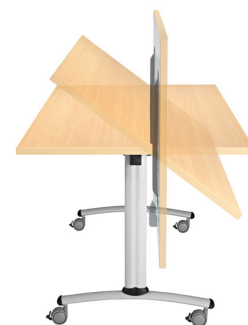
Installation ultra simple, rapide et sans effort