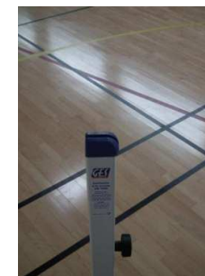
Position bad ou mini-bad