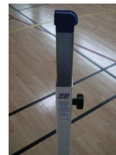
Position haute, standard